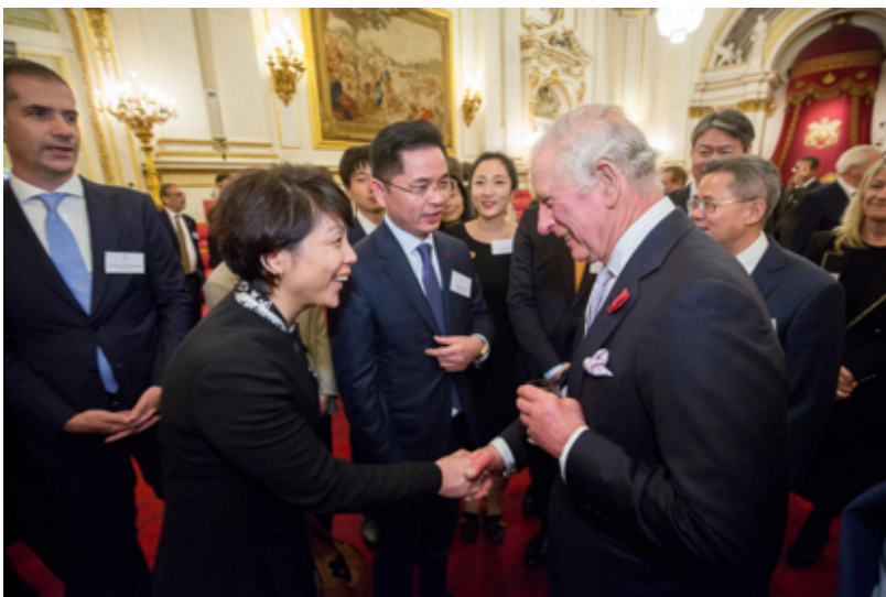
英国国王查尔斯三世在交流活动中亲切接见了中兴通讯高级副总裁肖明先生与晶澳科技助理总裁靳军辉女士