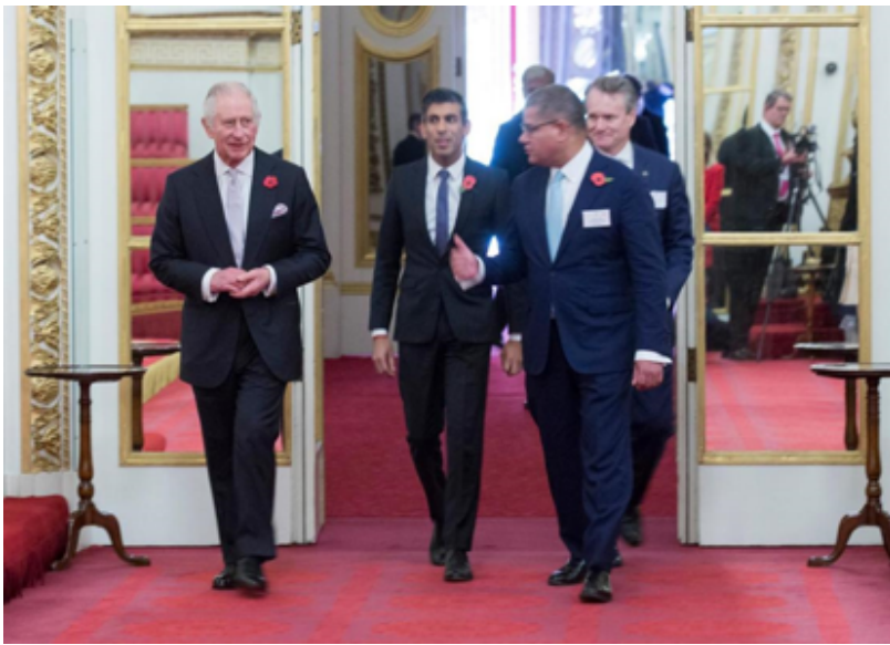
英国国王查尔斯三世、英国首相苏纳克出席活动