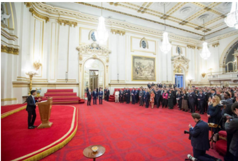
英国首相苏纳克发表演讲