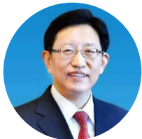
全国政协委员、中国节能党委书记、董事长 宋鑫 加快构建资源循环利用全产业链管理体系

利用,以工艺优化、科技创新,实现源头减碳、工艺降碳、末端用碳,推动公司绿色低碳发展,引领行业如期实现“碳达峰、碳中和”目标。