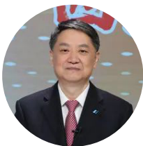
全国人大代表、中国华电集团董事长 温枢刚 聚力促转型 坚定不移走绿色低碳发展道路

3月初，2022年全国两会正式拉开帷幕，其中，十三届全国人大五次会议于2022年3月5日在北京召开，全国政协十三届五次会议于2022年3月4日在北京召开。随着两会时间开启，各界代表委员纷纷建言献策，这其中，就有中国国际商会企业家副会长，他们都说了些啥？