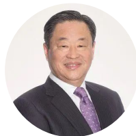
全国政协常委、中国中化董事长 宁高宁 推动绿色转型 践行低碳发展

全国人大代表、中国华电集团有限公司董事长温枢刚表示，面对新机遇新挑战，能源央企应继续走绿色低碳发展道路，推动高质量发展。要聚力促转型，紧紧围绕助力“双碳”目标，在绿色转型发展上迈出新步伐。聚力保供应，着力增强可持续的保供能力，提供安全稳定能源供给，以优异成绩为稳定宏观经济大盘、保持经济运行在合理区间、维护社会大局稳定作出更大贡献。