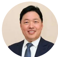
全国人大代表、步步高董事长 王填 推动村级集体经济纵深发展

做了大量调研论证工作的基础上,建议把长三角一体化发展“核心区”打造为“高新区”,以科创力量带动高质量发展。同时,他也在支持民企发展、提升社会综合能效、加快区域新型电力系统建设等方面建言献策,希望能够推动民营经济高质量发展,实现新业态创新,构建绿色低碳循环发展的经济体系,助力双碳目标实现。此外,还将建议对非公募慈善基金会的管理条例进行修改,以便更好地激发民营企业参与慈善事业的热情。