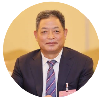
全国人大代表、大唐西市集团董事局主席 吕建中 建议加快制定数字经济促进法

全国人大代表、步步高董事长王填认为,积极探索创新集体经济的多种实践形式,高质量盘活农村闲置资源,多种方式发展集体经济,这对促进乡村共同富裕至关重要。建议进一步明确村级集体经济组织定位。在2017年全国农村集体资产清产核资的基础上,持续开展年度资产清查。对集体资产的权属、经营模式予以明确,合理界定集体经济组织与民营企业之间的合作经营范围,并列入相关组织治理的法律法规体系。同时,进一步动员民营企业参与村企合作。