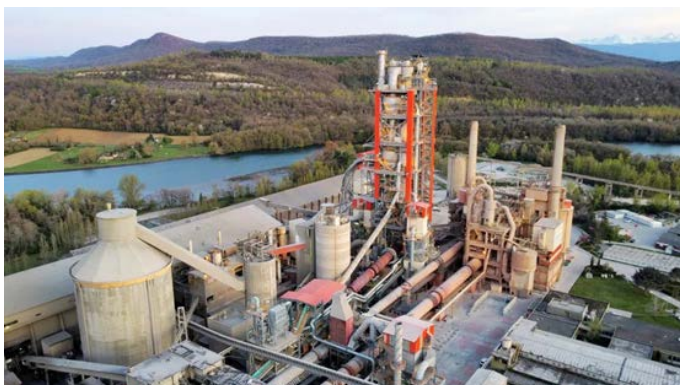
法国拉豪 MK3水泥生产线升级改造项目