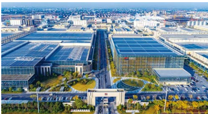
全球最大玻纤智能制造基地