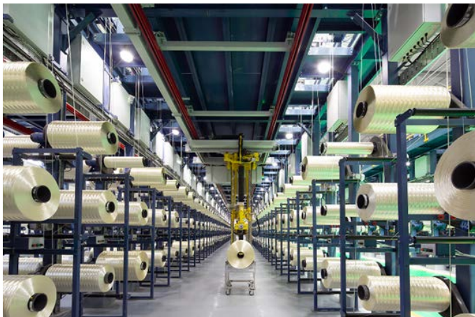
西宁高性能碳纤维智能生产线