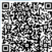
扫码查看评选详情

有意报名参加评选者请于2023年4月3日前将个人作品发送至研究所秘书处邮箱:iccprize@iccwbo.org。