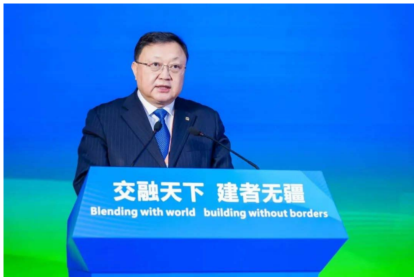
中交集团党委书记、董事长 王彤宙

2月27日，由外交部主办的驻华使节“步入中交”活动在京举行。来自110个驻华使馆和国际组织驻华代表机构的111人出席本次活动，其中包括20位驻华大使、7位临时代办和1位国际组织驻华代表。中交集团党委书记、董事长王彤宙出席活动并致辞，中交集团党委副书记、总经理王海怀，国务院国资委国际合作局有关负责同志出席活动，外交部礼宾司副司长李响主持活动。