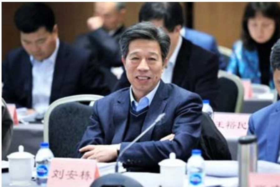
中国中钢集团党委书记、董事长 刘安栋

“2023年，钢铁行业发展形势既有机遇也有挑战。在加入宝武大家庭的背景下，中钢也面临着更多机会。我们将加速与中国宝武的整合融合，加快培育宝武生态圈龙头企业地位，为建设世界一流伟大企业贡献中钢力量。”2月12日，在中国钢铁工业协会第六届会员大会第五次会议前夕的常务理事会议间隙，中国钢铁工业协会副会长，中国中钢集团党委书记、董事长刘安栋接受了《中国冶金报》记者采访，围绕企业与中国宝武重组事宜及未来发展进行了介绍。